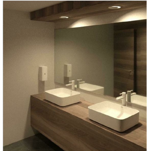
2 Aseo mixto 1.2 1:1